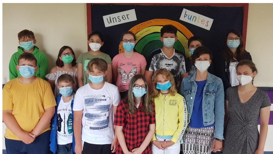
Schulprojekt an der Mittelschule Pocking Sponsor: Sparkasse Passau