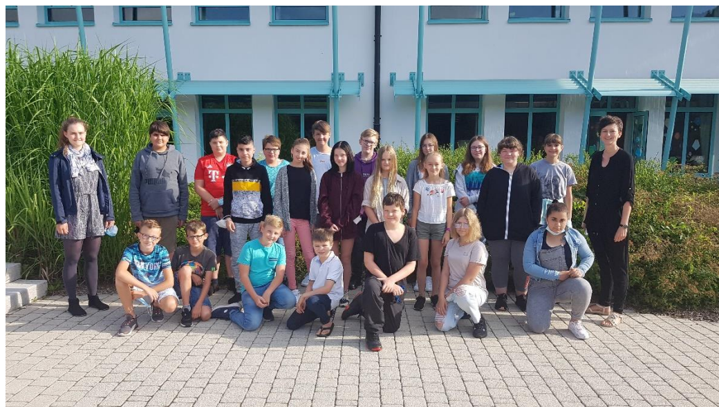
Schulprojekt an der Mittelschule Eging a. See