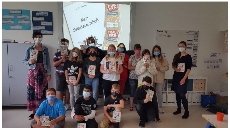
Schulprojekt an der Anne-Frank-Schule Pocking Sponsor: InnerWheel Club Passau