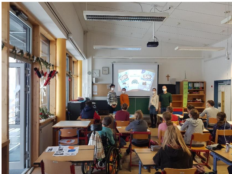
Schulprojekt in der Don-Bosco-Schule Passau