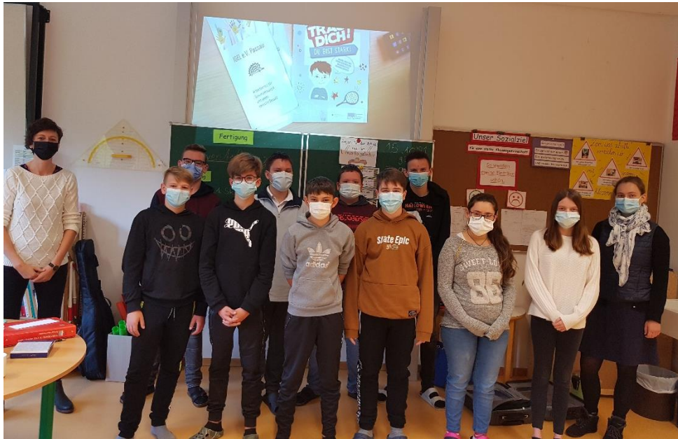
Schulprojekt an der Michael Atzesberger-Schule, Hauzenberg