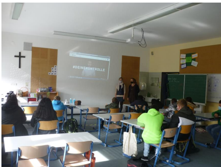
Schulprojekt an der Mittelschule Salzweg