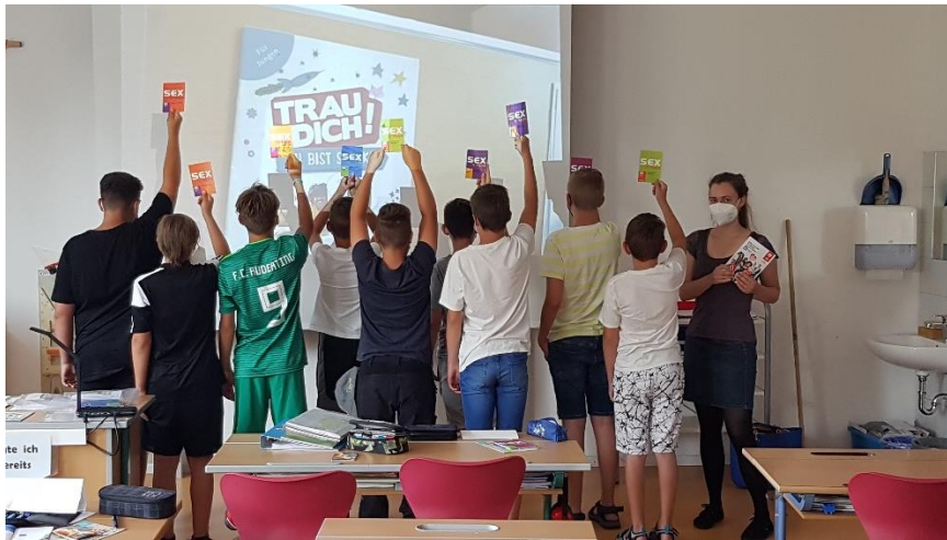
Schulprojekt an der Mittelschule Tiefenbach